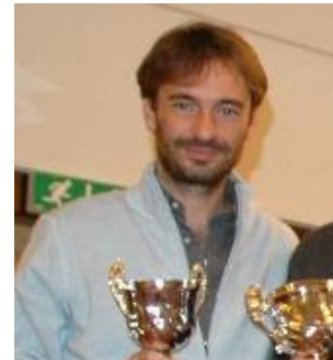
Bufalo Ragioniere all'esordio in una GF

- la piadina finale (offerta da Buf. Ragioniere per celebrare il suo "battesimo" nelle GF) prima di ripartire per Roma.